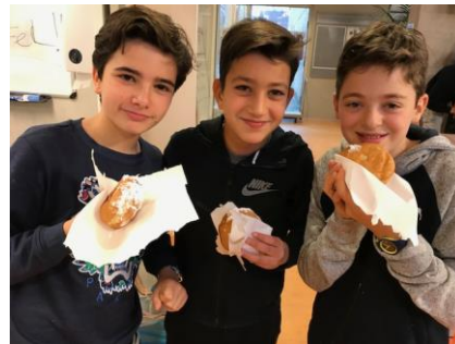
Soefganiot voor Chanoeke!